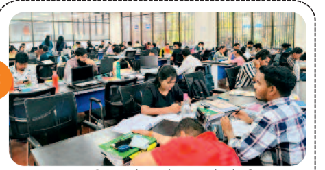
नालंदा परिसर में स्टूडेंट्स को होली ....